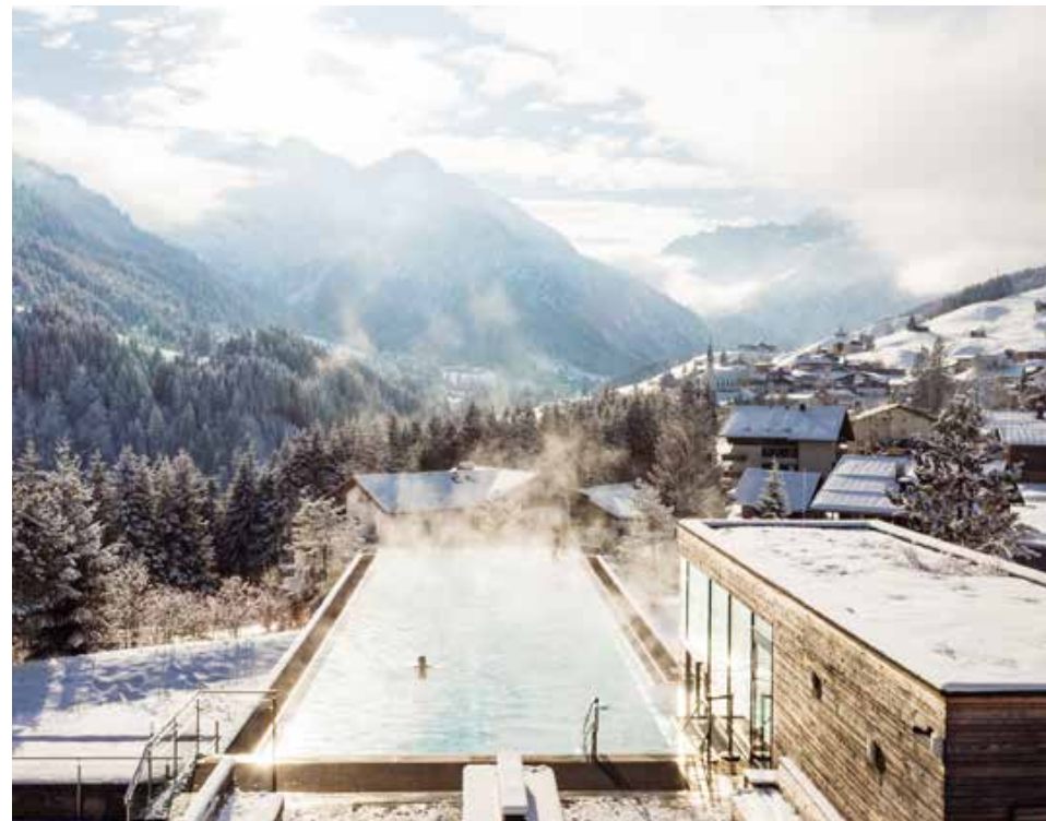
Imposanter Ausblick vom Wellnessbereich im Ifen Hotel.