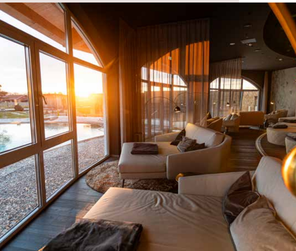
Ruhe und Weitblick genießen Gäste im Hotel König Ludwig.