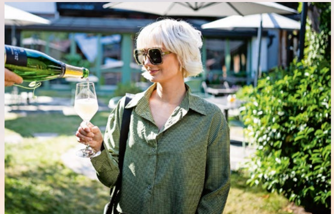
Ein Augenblick zum Anstoßen – Urlaubsglück in den AllgäuTopHotels.

Über 80 familiengeführte 4- und 5-Sterne-Häuser gehören zu den AllgäuTopHotels – jedes auf seine Weise besonders. Viele Gastgeber setzen schon seit Jahren auf Regionalität und Nachhaltigkeit – aus Überzeugung. Das schmeckt man in den kreativen Küchen, das spürt man in der Atmosphäre und das sieht man in jedem liebevoll gestalteten Detail. Und wenn das Wetter mal nicht mitspielt? Dann laden Spa, Sauna und ein gutes Buch zum Innehalten ein – oder zum produktiven Innehalten mit Laptop und Weitblick.